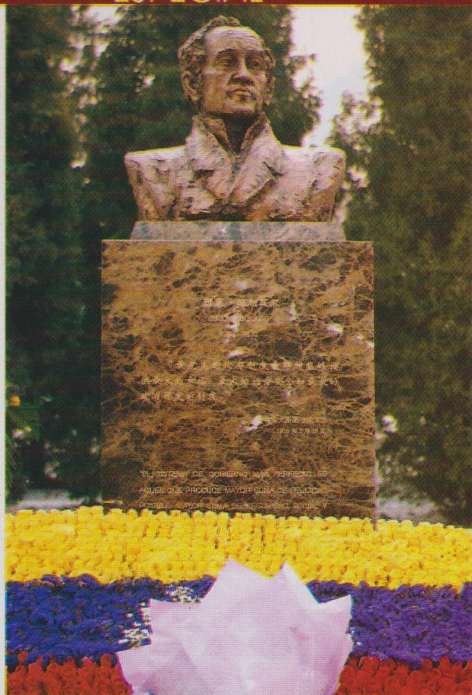
Busto de bronce del Libertador Latinoamericano Simón Bolívar en el parque Chaoyang de Beijing

el contrato de Intercampo y Los Caracoles en 1997, en la tercera ronda de licitación de petróleo internacional de Venezuela, ahora coopera con la entidad venezolana PDVSA en la construcción de la Orimulsion de Venezuela. El 19 de agosto de 2004, la Cía de Daqing en Venezuela, subordinada a la Corporación de Ingeniería Internacional de Petróleo de Daqing, obtuvo el proyecto de exploración sísmológica de tres dimensiones en una superficie de 466 kilómetros cuadrados de la PDVSA. Todos estos proyectos marchan sobre rieles.