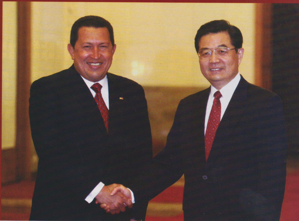
El presidente Hu Jintao da la bienvenida al presidente venezolano Chávez