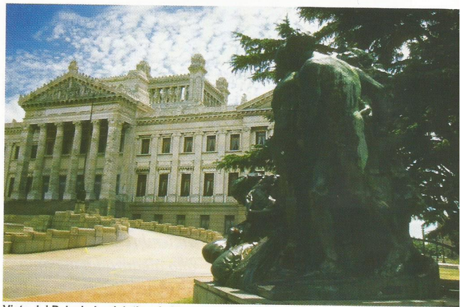
Vista del Palacio Legislativo de Montevideo, Uruguay.

LA: Eso es algo que es prioritario para esta embajada y desde que llegué a Beijing he trabajado en ese sentido. Uruguay no está utilizando de manera adecuada y suficiente estos instrumentos. Para nosotros esto es un imperativo y ya logramos que este año se firmara un acuerdo entre la Univer-