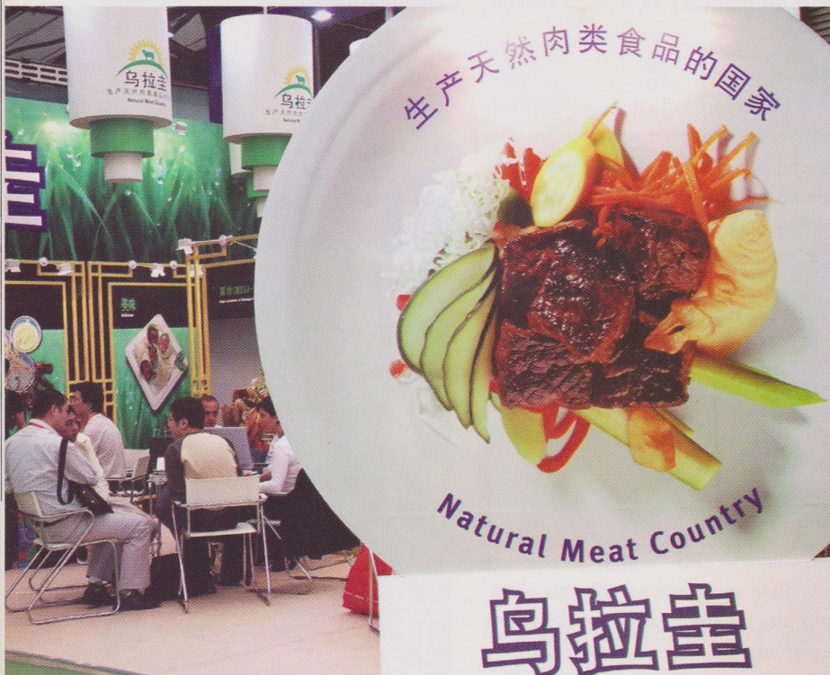
Stand de Uruguay en la Exposición Internacional de Alimentos y Bebidas de China.

Dr. Luis Almagro: La relación bilateral en estos 20 años ha tenido un particular desarrollo, que se ha ido afirmando. Si uno ve lo que son las visitas de alto nivel, ve que todos los