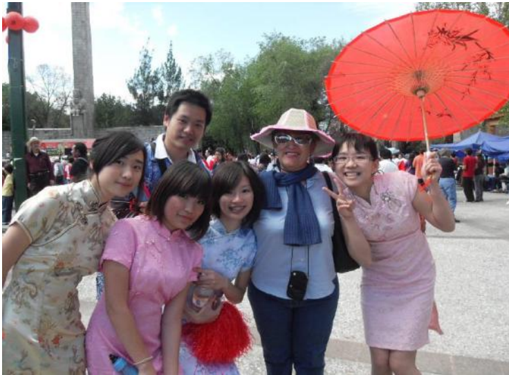
Desfile de año nuevo chino 2008. Monumento a la Madre. CDMX

1ª oleada porque contiene en sí misma los rasgos diaspóricos más fundamentales como son: la dispersión debido a una expulsión traumática, la difícil asimilación o el rechazo de la sociedad receptora, la filiación definida por el parentesco y la comunidad, y la identidad delineada por la memoria colectiva y la conciencia diaspórica, entre otras características.