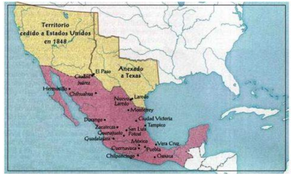
Mapa del Territorio Perdido Por México